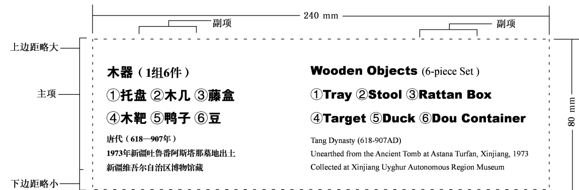
图 A.10 组类带编号标牌范例